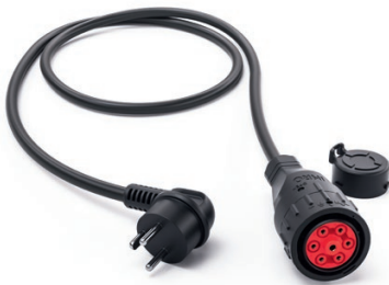
Adapter Dänemark 9900213

Länge: 1,6 m Schutzart: IP 44 Spannung: 230 V Strom: 13 A Ladeleistung: 3 kW Temperaturüberwachung: Ja