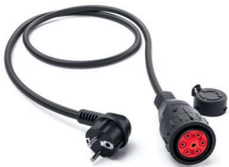
Adapter Schuko 9900216

Länge: 0,5 m Schutzart: IP 54 Spannung: 230 V Strom: 16 A Ladeleistung: 3,7 kW