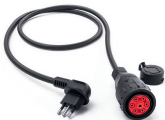
Adapter Italien 9900215

Länge: 1,6 m Schutzart: IP 20 Spannung: 230 V Strom: 10 A Ladeleistung: 2,3 kW Temperaturüberwachung: Ja