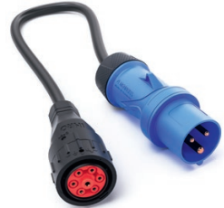
Adapter CEE 16 A 1-phasig 9900211

Länge: 0,5 m Schutzart: IP 54 Spannung: 230 / 400 V Strom: 16 A Ladeleistung: 11 kW