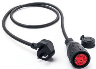
Adapter Großbritannien 9900214

Länge: 1,6 m Schutzart: IP 20 Spannung: 230 V Strom: 6 A Ladeleistung: 1,4 kW Temperaturüberwachung: Ja