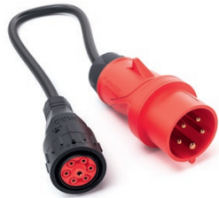
Adapter CEE 16 A 3-phasig 9900212

Länge: 0,5 m Schutzart: IP 54 Spannung: 230 / 400 V Strom: 16 A Ladeleistung: 11 kW