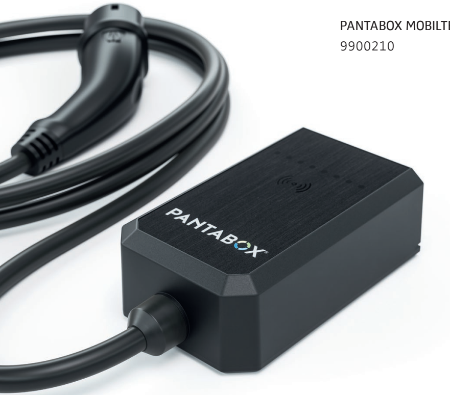
PANTABOX MOBILTEIL 9900210

maximale Ladeleistung: 11 kW Ladeleitung: Typ 2 | 5 m Schutzart: IP 67 Spannung: 230 / 400 V Ladestrom: 6 - 16 A Überfahrtsicherheit: bis 1.100 kg Gewicht: 2,7 kg Kommunikation: Bluetooth, WLAN und RFID