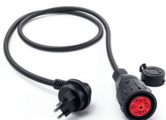
Adapter Schweiz 9900217

Länge: 1,6 m Schutzart: IP 20 Spannung: 230 V Strom: 10 A Ladeleistung: 2,3 kW Temperaturüberwachung: Ja